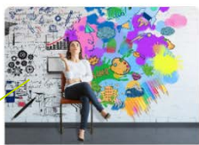
Рекрутинг - это творчество