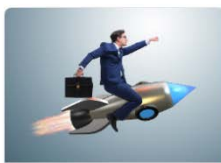
Как закрыть вакансию за 4