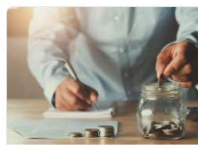
Куда исчезают деньги